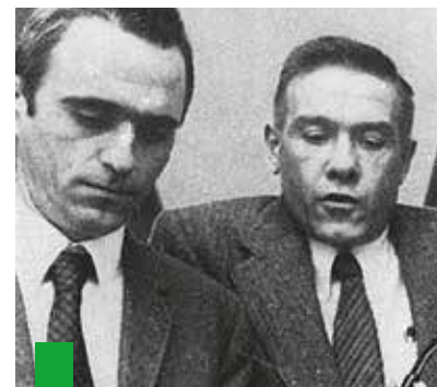
Carniti insieme al leader della Cgil Bruno Trentin.

Carniti è stata una figura di grandissimo rilievo, che resterà a lungo un esempio da cui prendere ispirazione; tocca ai sindacalisti di oggi, e innanzitutto ai suoi amati metalmeccanici, saper raccogliere questa preziosa eredità. A me, che ho avuto la fortuna di essergli accanto nella sua esperienze milanese, rimane il lascito di un'esperienza indimenticabile e il valore di un'amicizia che rimane intatta.