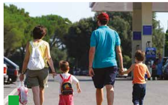
Cambiano i criteri per il calcolo delle facilitazioni per chi ha familiari a carico.

Reddito fino a 25.942,18 € Importo Anf = 326,67 € mensili