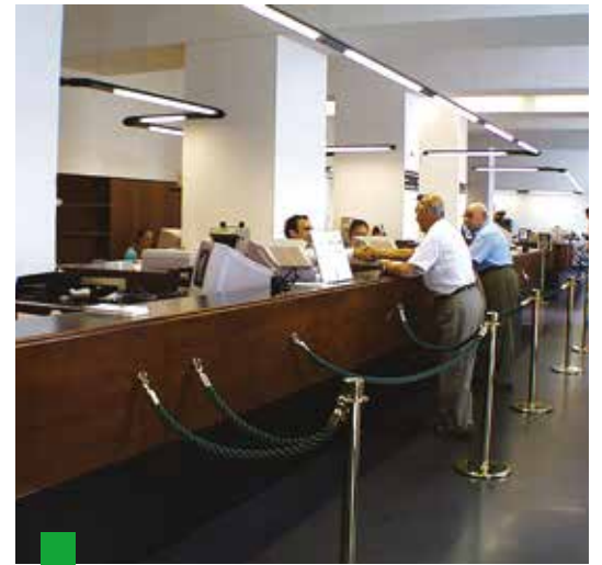
Drastico calo degli occupati nelle banche che però continuano a fare profitti. Sempre meno sportelli sul territorio.

ti in province come Torino o Bergamo, che nell'ultimo anno sembrano cresciute l'una di 3.000 e l'altra di 500 addetti, mentre non è così.