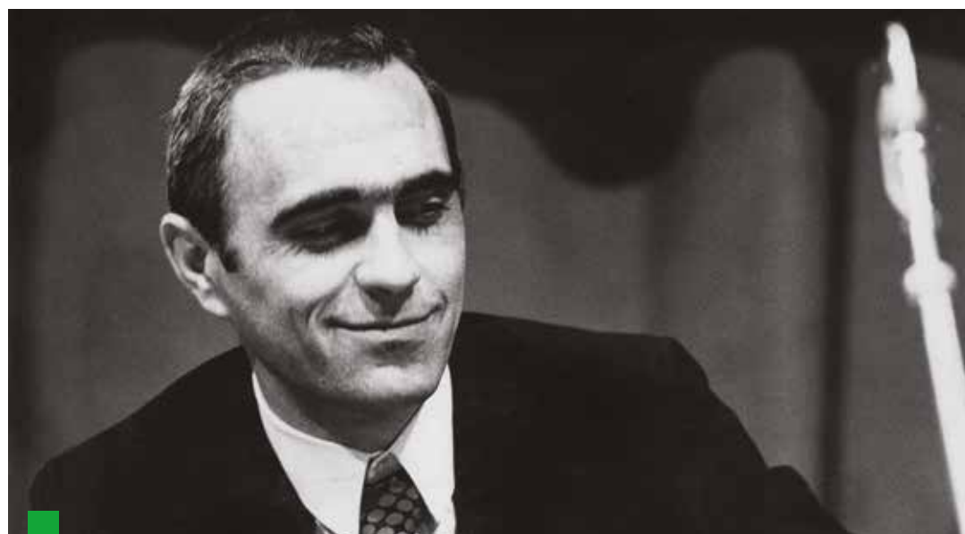
Pierre Carniti, nato a Castelleone, in provincia di Cremona il 25 settembre del 1936, nipote della poetessa Alda Merini, operatore sindacale nel Milanese. Nel 1970 era diventato segretario della Fim, l'organizzazione dei metalmeccanici della Cisl, di cui era diventato poi segretario generale nazionale dal 1979 al 1985. Dal 1989 al 1999 è stato deputato europeo per due legislature, prima per il Psi poi come indipendente nelle file dei Democratici di Sinistra. Ha presieduto una Commissione sulla povertà.

La Fim di Milano e quelle altre vicine che poi formarono la nuova Fim nazionale rappresentavano un caso raro; costituivano un esempio rarissimo di "sinistra sindacale". C'è tanta sinistra nel sindacato e tanti sindacati di sinistra nel mondo, ma si tratta praticamente sempre di una sinistra politica che opera nel sindacato. La sinistra sindacale è un'altra cosa: parte dai problemi dei lavoratori e con essi agisce e lotta per cambiare la loro condizione.