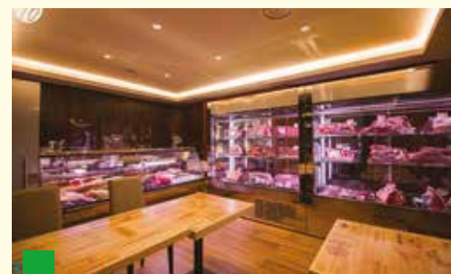
Il trend del momento: la risto-macelleria.