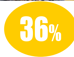
Le coppie italiane con figli

corre muoversi per non finire dentro al burrone. È per questo che secondo l'esperta il tentativo di cambiamento avviato da Regione Lombardia è comunque positivo. “Indubbiamente la nostra regione continua ad essere un punto di riferimento rispetto alle proposte di riorganizzazione del sistema. Quello proposto è certamente un modello assai innovativo, un vero e proprio ‘shock’ a livello sistemico che però richiede tempo”. Perché dietro al passaggio da Asl a Ats così come quello da Aziende ospedaliere ad Asst c'è molto di più di semplici sigle. “Senza dubbio finora l'accompagnamento alle aziende e ai suoi professionisti è stato debole, tanto più rispetto ad un tema delicato qual è quello della cronicità”. Banalmente, sono mancati anche gli strumenti. Facendo un esempio, per la realizzazione