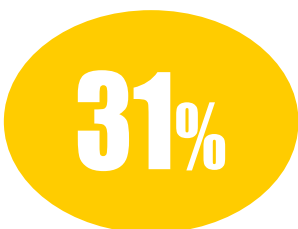
Le famiglie mononucleari (anziani e single)

del Pai (ossia i piani di assistenza individuale) sarebbe stato utile poter contare su di un unico gestionale regionale che ad oggi manca. Ma anche qui l'intuizione di ricucire - tramite il nuovo percorso di ‘presa in carico’ la figura di chi si assume la responsabilità di redigere il piano clinico del paziente con chi poi gestisce materialmente a livello logistico organizzativo i diversi passaggi di questo vero e proprio ‘ricettone’ - secondo la docente della Bocconi - è innovativa e concettualmente corretta. “Certo ora si tratta di capire se andrà a buon fine – aggiunge – c'è poi il rischio di avere un sistema a due velocità, in quanto, certamente i soggetti privati accreditati potranno rispetto al pubblico muoversi più in fretta. Anche per questo l'esigenza di un sostegno per il pubblico a livello regionale appare ancora più forte”. “I correttivi li potremo vedere solo cammin facendo. Quello recente, che ha portato a un rafforzamento del ruolo dei medici di medicina generale e dei pediatri di libera scelta, è un primo passaggio. Di aggiustamenti ce ne saranno ancora. Per questo è fondamentale tenere un canale di dialogo costantemente aperto e, soprattutto sostenere le istanze che arrivano dal basso”.