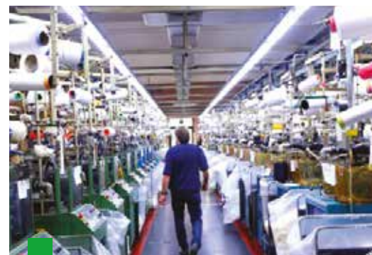
Il distretto delle calze di Castiglione delle Stiviere e Castel Goffredo

dieci. Le politiche bancarie si sono concentrate sul taglio dei costi anziché sulla vicinanza al tessuto locale e si è preferita la vendita frettolosa degli Npl a una gestione paziente dei crediti problematici che avrebbe permesso a molte imprese di tornare in bonis, rilanciando