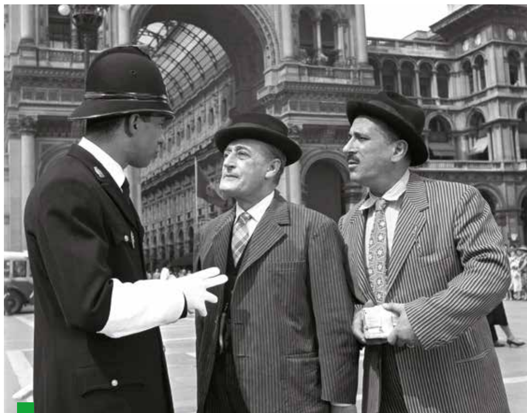
Totò e Peppino e la Malafemmina. Il dialogo con il ghisa in piazza Duomo

La sequenza di Peppino e Totò che chiedono informazioni al ghisa è il simbolo del rapporto tra la cinematografia e il capoluogo lombardo