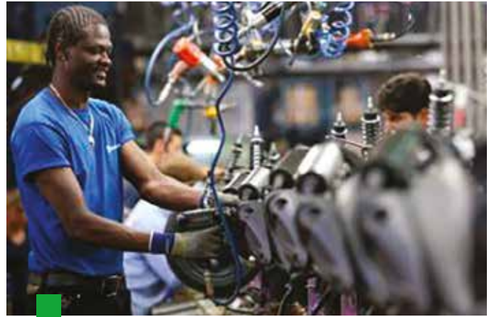
La ricerca di lavoro è una delle motivazioni principali dell'immigrazione verso l'Italia

Non sono pochi gli stranieri con spirito imprenditoriale. Le imprese gestite da immigrati in