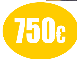
È la spesa procapite in Lombardia, meno di 300 in Campania