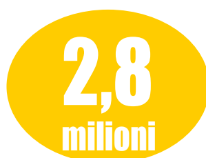
Le persone non autosufficienti in Italia