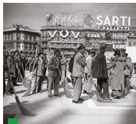
Comparsa di "Miracolo a Milano" di Vittorio De Sica, 1951