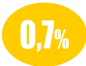
L'incremento della spesa sanitaria in Italia dal 2010 al 2016. Meno dell'inflazione