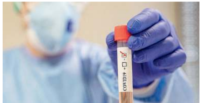
In ospedale. Molte denunce all'Inail per casi legati al Covid