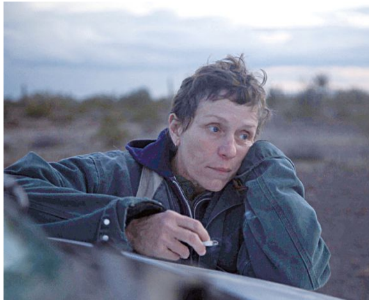
«Nomadland» di Chloé Zhao è fra i titoli del «Labour Film Festival»

Ci sono opere strapremiate come Nomadland di Chloé Zhao, Oscar per il miglior film, la miglior regia e la migliore attrice protagonista (Frances McDormand), per non dire del Golden Globe e del Leone d'Oro conquistati da questa storia di vita itinerante, fragile, emarginata, e di inedite solidarietà spuntate come fiori di strada fra le macerie economiche e sociali dell'Ovest degli Stati Uniti. E ci sono titoli, registi, attori sconosciuti al grande pubblico, con le loro storie così spesso lasciate ai margini o fuori dalla "dieta mediatica" dei più. Ci sono lungometraggi di fiction, cortometraggi e documentari. E c'è pure una mostra di fotografia. Il denominatore comune? Sono tutte storie di lavoro e di lavoratori. Provenienti da tutto il mondo. E c'è dentro tutto il mondo del lavoro: con le sue fatiche, le contraddizioni, le ingiustizie, ma anche i semi di speranza, solidarietà, riscatto. Il lavoro che è stato, il lavoro che verrà. Benvenuti al «Labour Film Festival», la rassegna dedicata all'incontro fra cinema e lavoro, promossa da Cisl e Acli Lombardia con il Cinema Rondinella di Sesto San Giovanni (Milano), che si terrà dal 2 settembre